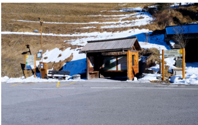
La nouvelle signalétique routière

Il est rappelé que seules les enseignes situées sur le lieu d'exploitation sont autorisées, à condition de respecter les règles de l'AVAP. Ces installations doivent également faire l'objet d'une déclaration préalable.