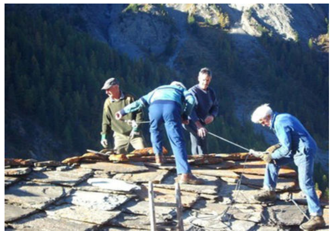
Travaux à la Chapelle Sainte-Elisabeth

Cette année, la commune a financé trois panneaux (au four de la Ville, à la pompe à incendie et au Temple), et poursuivra son effort en accordant un petit budget à l'entretien de ce petit patrimoine.