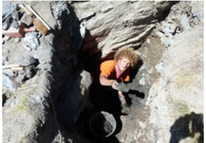
Sondage archéologique sur la mine, campagne 2012

« Saint-Véran, la montagne, le cuivre et l'homme » t2, Hélène BARGE (en vente à l'Arbiot).