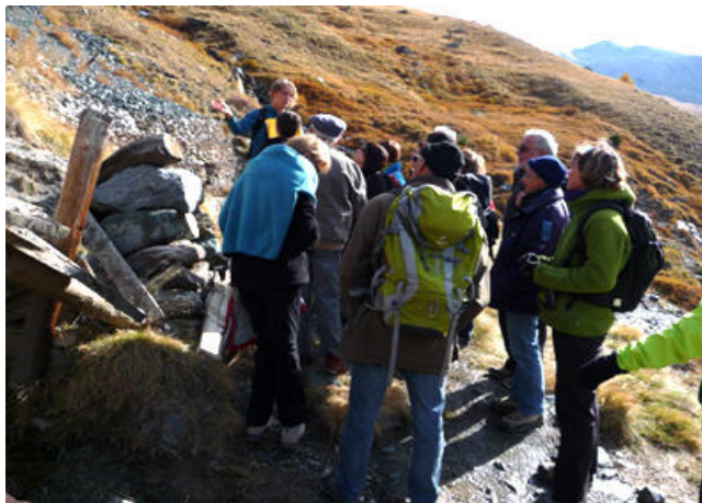
Sortie avec le Parc naturel régional du Queyras sur les pas des mineurs